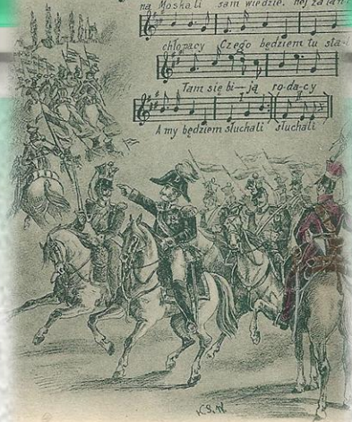
Gen. JÓZEF DWERNICKI POD STOCZKIEM (1831).